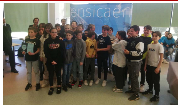
Les élèves du collège Challemel Lacour d'Avranches ont reçu le "Prix Génialissime".